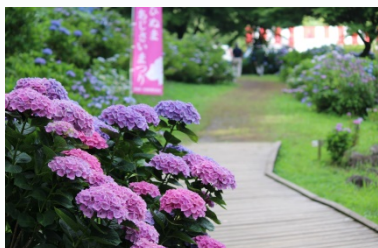
ひめまあじさいまつり

さらに、近年、広浦地区において、地域住民による農家民泊や農漁業体験の取り組みが行われ、国内はもとより台湾やタイなどの国外からも、多くの子どもたちが訪れており、インバウンドを中心とした農家民泊となっています。