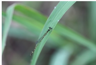
ヒヌマイトトンボ (雄)

本町は、東部に関東唯一の汽水湖である涸沼を有するとともに、これに注ぐ涸沼川・涸沼前川・寛政川が中央部を流れ、その流域には田園が一面に広がり、うるおいあふれる水辺と輝く緑につつまれた豊かな自然が息づいています。