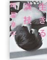
生きる演技 (町屋 良平 著)