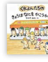
くれよんたちのきょうはなにをかこうかな? (なかや みわさく 著)