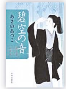
碧空の音 (あさの あつこ 著)

わけありの女たちを診療するお父さんの許へ、何かを極度に怖れている妊婦が訪ねてきた。彼女は目を血走らせ、十両を差し出しながら言った。「お願いします。この子を産ませてください」と。後日、吉原惣名主に依頼され診ることになった女郎も、奇矯な妊婦だった。彼女たちの言動に疑念を抱いたお父さんは、廓の用心棒・甲三郎らの力を借り、その謎に迫ろうとするが…。