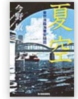
夏空 (今野 敏 著)