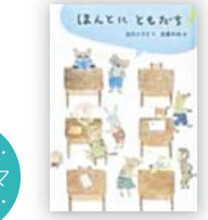
ほんとにともだち? (如月 かずさ 作)