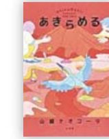
あきらめる (山崎 ナオコ 著)