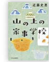
山の上の家事学校 (近藤 史恵 著)