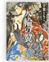
火輪の翼 (千葉 ともこ 著)