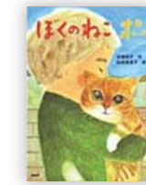
ぼくのねこ ポー (岩瀬 成子 作)