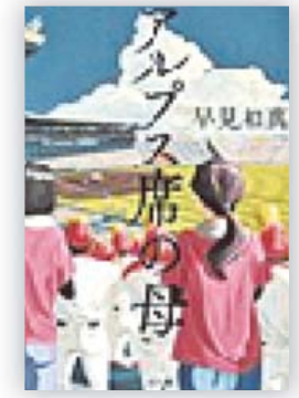
アルプス席の母 (早見 和真 著)

秋山菜々子は、神奈川で看護師をしながら一人息子の航太郎を育てていた。航太郎は甲子園常連校を倒すことを夢見て、大阪の新興校に進学する。息子とともに、菜々子もまた大阪に拠点を移すことを決意する。不慣れな土地での暮らし、厳しい父母会の掟、激瘦せしていく息子の。果たしてふたりの夢は叶うのか！？ 『産経新聞』大阪版夕刊連載に加筆・改稿。