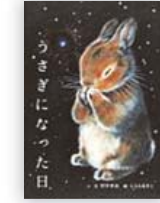
うさぎになった日 (村中 李衣文 著)