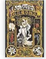
妖花魔草物語 (廣嶋 玲子 作)