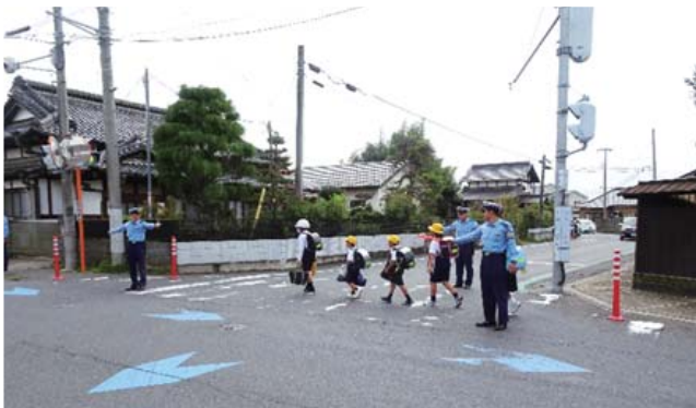
長岡小付近の交差点

9月30日(月)の朝、茨城県警察学校(上石崎)の初任科生39名(4月1日採用)が、長岡小学校と葵小学校の通学路で、登校児童の見守り活動を行いました。「おはよう。いってらっしゃい。」と声を掛ける新人警察官たち。子どもたちは、大きな声で元気よく「いってきます。」とあいさつを返していました。子どもたちの笑顔に元気を貰った新人警察官たちは、令和7年1月に警察学校を卒業し、各赴任地に配属される予定です。