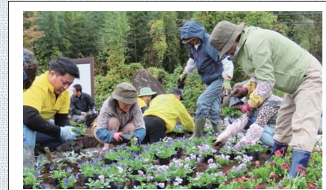
令和6年11月15日の植え替えの様子

公園内の花壇はすべて、 「茨城町ハッピーガーデン」の メンバーがデザインしています。