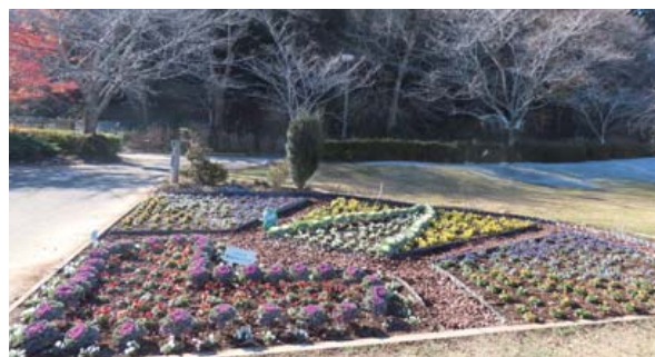
公園に入っすぐ！ ぜひ中を通って近くで見てくださいね♪

花のボランティア「茨城町ハッピーガーデン」が、花の抜き取り作業や土づくりをアドバイス。植え替え当日までの作業がスムーズに進みました。