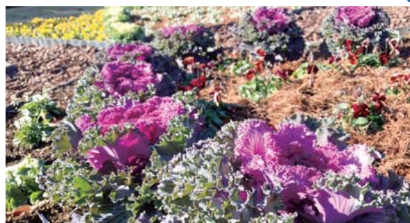
アジサイがお休みの期間も、 きれいな花壇で皆様をお迎えます。

【涸沼自然公園に関する問合せ】 商工観光課 ☎029-240-7124 (直通)