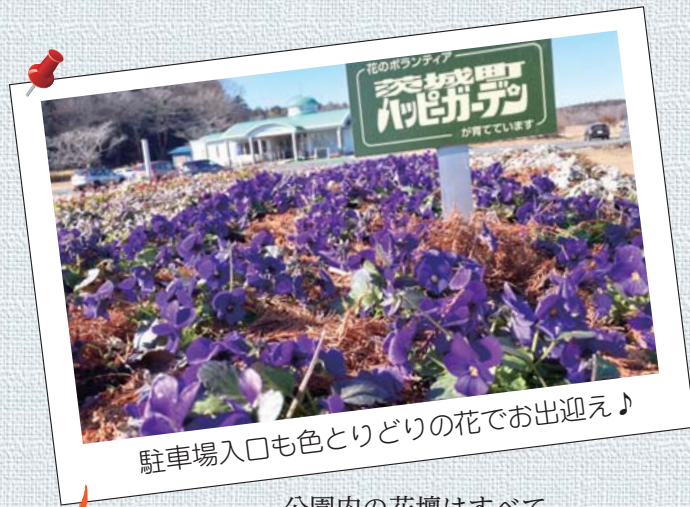
駐車場入口も色とりどりの花でお出迎え♪

公園内の花壇はすべて、 「茨城町ハッピーガーデン」の メンバーがデザインしています。