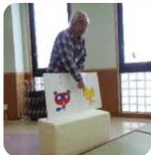
おはなしの会「しらゆきひめ」の方の読み聞かせ 楽しいおはなしの世界にいらっしやい☆