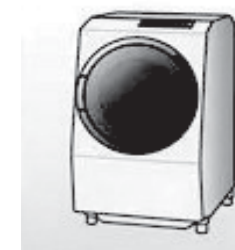
④ 洗濯機・衣類乾燥機