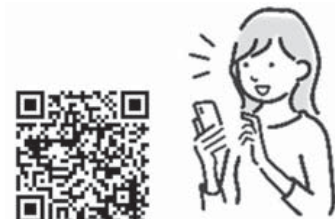
町ホームページはこちら