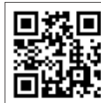
熱中症予防情報サイト

◆広報いばらき7月1日号掲載のすこやかニュース「熱中症予防は自己管理が肝心！」および健康レシピ「熱中症予防レシピ」もぜひご覧ください。